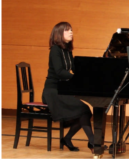
特典ショパン作曲「ノクターン」 収録風景 (14.02.06)